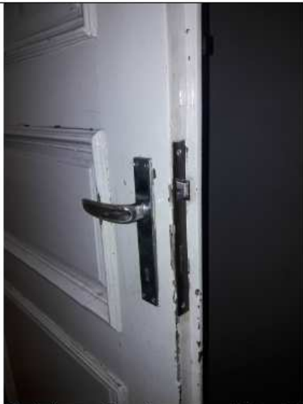
1_Maniglia porta Bagno lato vano scale Piano Terra