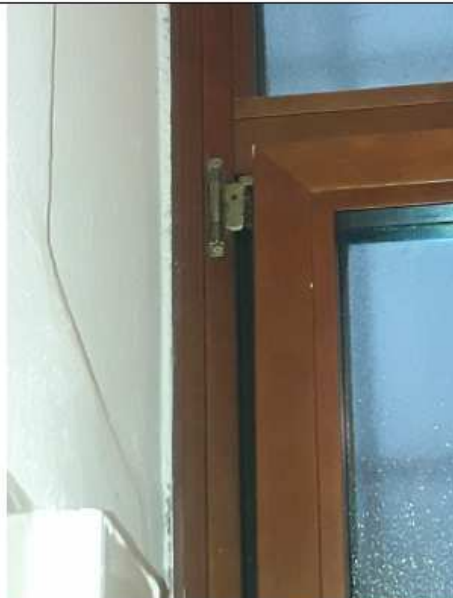
2_Infisso scardinato - bagno donne Piano Terra Back Office