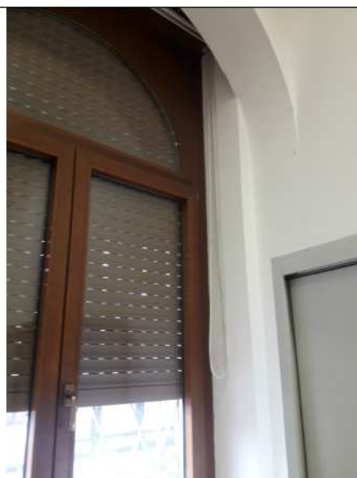
5 Tapparella con corda per apertura manuale rotta PT