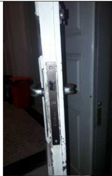
1_Maniglia porta Bagno lato vano scale Piano Terra