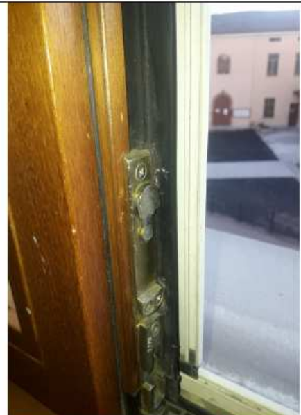
3_Perni apertura rotto - stanza 106 Piano Primo