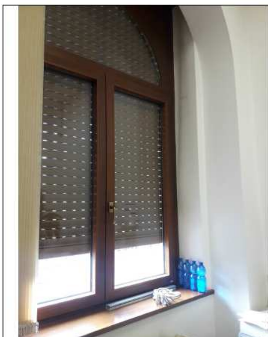
4 Tapparella con corda per apertura manuale rotta PT